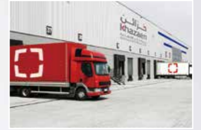
卡桑工商城 Khazaen Economic City www.khazaen.om/start/city-of-the-future/