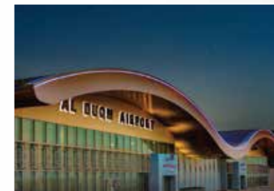
杜康自由貿易區 Duqm Free Zone https://duqm.gov.om/en/sezad