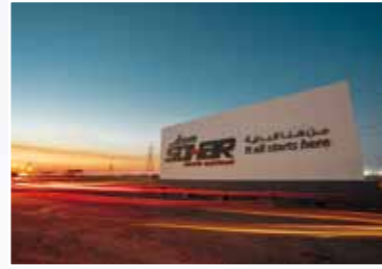
索哈爾自由貿易區 Sohar Free Zone soharportandfreezone.com/