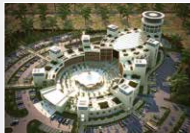
薩拉拉自由貿易區 Salalah Free Zone https://sfzco.com/