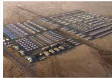
伊卜里工商城 Ibri Industrial City