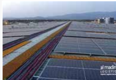
阿瑪竺納自由貿易區 Al Mazunah Free Zone madayn.om/sites/AFZ/EN/Pages/home.aspx